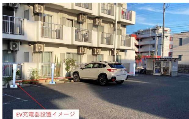
駐車場へのEV充電器設置イメージ

サステナビリティは企業経営において極めて重要な要素であり、『リロのEV駐車場』のサービスはグローバル規模での未来社会・環境貢献・企業の優位性につながるものと考えております。